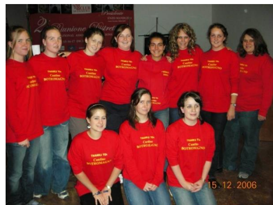
Altamura 9-17 dicembre 2006. Il Campo Giovani Invernale "Murge", organizzato dal Club Altamura Host, tutto al femminile.

Dal 5 al 13 dicembre 2009 si tenne la 5^ edizione del Campo Invernale Puglia, questa volta trasformato dal Distretto 108Ab Puglia da Campo di Club a Campo Distrettuale, con Governatore Licia Bitritto Polignano, originando così il 1° Campo Invernale Distrettuale in Italia, subito dopo imitato da altri Distretti Italiani. Al sottoscritto venne affidato il ruolo di Direttore del Campo.