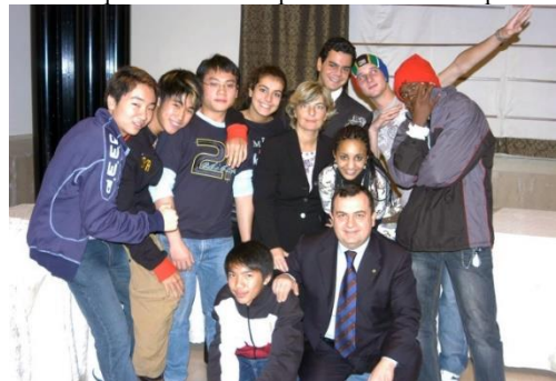
Altamura - 12-18 dicembre 2005 - Il primo Campo Giovani Invernale organizzato dal Club di Altamura Host

gli Scambi Giovanili, che da sempre avevano consentito a tanti giovani pugliesi di vivere una fantastica esperienza di valore internazionale, conoscendo culture, storia, modi di vivere, tradizioni molto diverse tra loro e vivendo un'esperienza formativa unica.