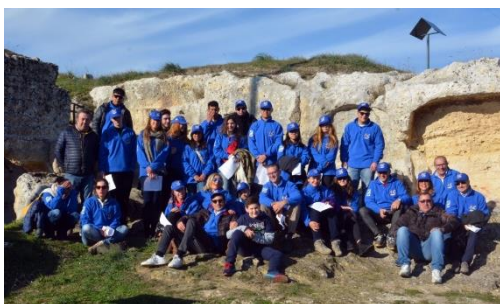
Gravina. Dicembre 2015. I partecipanti all'Archéo Club di Puglia, nell'ambito del Campo Invernale Italia.

L'idea è stata vincente ed ha avuto un grande eco in tutto il Multidistretto. Il Campo si è tenuto dal 13 al 20