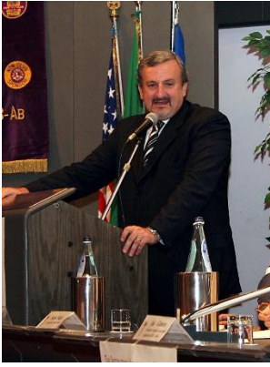
Il Sindaco di Bari Michele Emiliano

viene chiamato a presiederla indicendo la prima Convention costitutiva per l'8 ottobre dello stesso anno a Dallas in Texas all'Hotel Adolphus (ove chi scrive - impensabile! - ebbe il seminario di formazione per Governatore nel 1968).