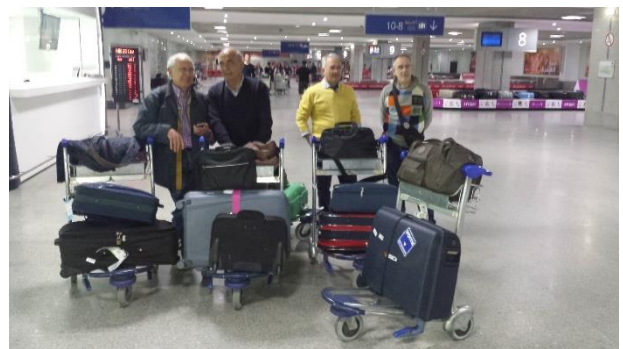
Le missioni nel mondo

Sono stati creati dei Centri Sanitari SO.SAN. in alcuni Distretti Lions Italiani, altri ne stanno nascendo.